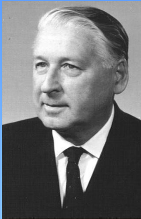
акад. А.Л. Курсанов (1902-1999)